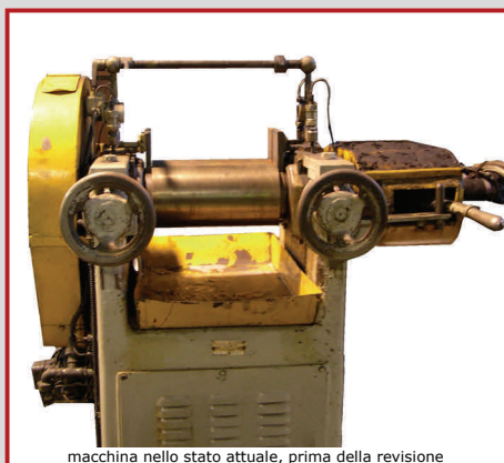
macchina nello stato attuale, prima della revisione